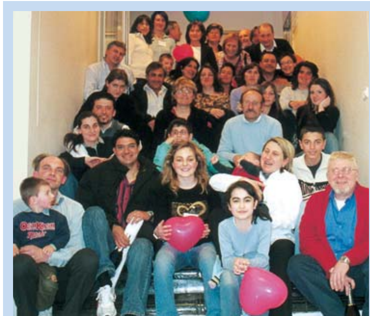
Foto di gruppo alla festa AIPI del 26 marzo

Un saluto affettuoso, ci rivediamo a Settembre..